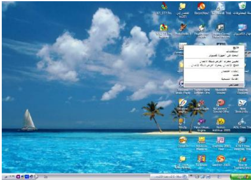
شكل ( ٥-٢ )